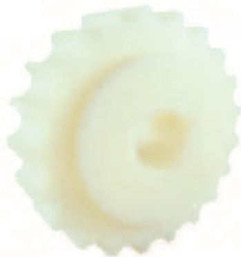
ENGRENAGEM USINADA (PARA CORRENTES 812/815 MINI)