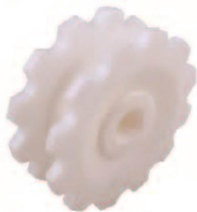
ENGRENAGEM USINADA (PARA CORRENTE FLEXÍVEL N-H103 Series)