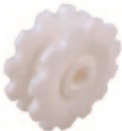
ENGRENAGEM USINADA (PARA CORRENTE FLEXÍVEL N-M833 Series)