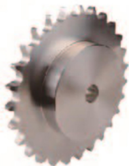
ENGRENAGEM EM AÇO - 60 (PARA CORRENTES 863, 963, 1864, 1873, 1874, 3873)