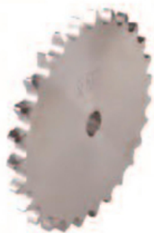
ENGRENAGEM EM AÇO - 40 (PARA CORRENTE 843, 845, 1843)