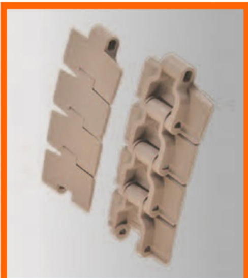
LF 880M MAGNÉTICA MOVIMENTAÇÃO CURVA