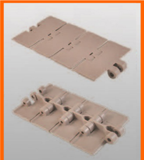
LF 820 SINGLE HINGE MOVIMENTAÇÃO RETA