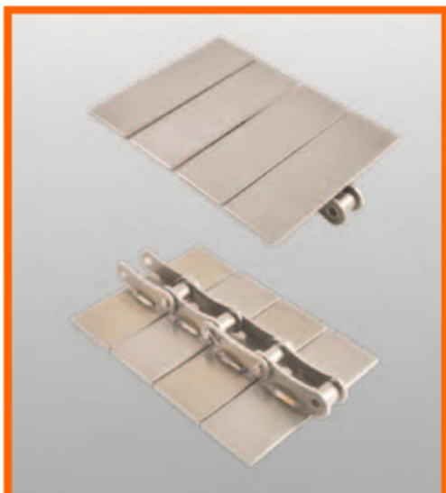
WTP - WELDED TOP PLATE MOVIMENTAÇÃO RETA