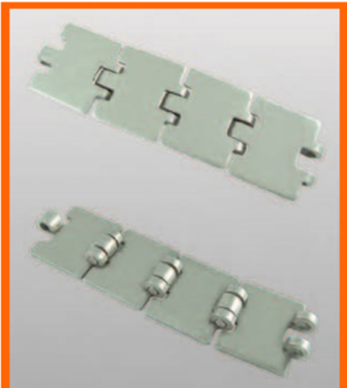
SS 812/815 MINI SINGLE HINGE MOVIMENTAÇÃO RETA